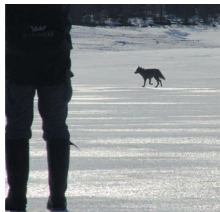
Vandringsvarg på is.

Vill du läsa mer om vad som hänt i olika revir genom åren kan du läsa våra inventeringsrapporter på www.lansstyrelsen.se .