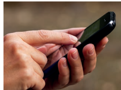
Ring 010-224 86 40 vid angrepp.

Om besiktningen visar att skadan orsakats av rovdjur kan djurägaren få ersättning för skadade eller döda djur. Besiktningen kostar inte djurägaren någonting.